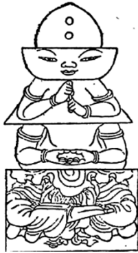
【Ⅱ図】「真言者、圓壇に先ず自体を置け」