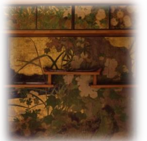
宸殿違棚貼付絵 国宝 長谷川等伯筆 『松に黄蜀葵及菊図』部分