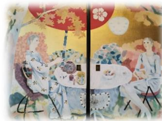
宸殿 堂本印象画伯の襖絵

宸殿「三山の間」の違棚に収められている長谷川等伯筆国宝障壁画は、現在収蔵庫に展示されている「松に黄蜀葵及菊図」の一部分とされています。普段は非公開の国宝障壁画と堂本印象画伯の襖絵を目近にご覧いただけます。